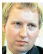
Johannes Varwick sieht für Guterres gute Bedingungen.

Varwick: Guterres wird natürlich seine Erfahrung als Uno-Hochkommissar für Flüchtlinge einbringen. Das Thema Flucht und Migration ist ein zentrales Thema für ihn.